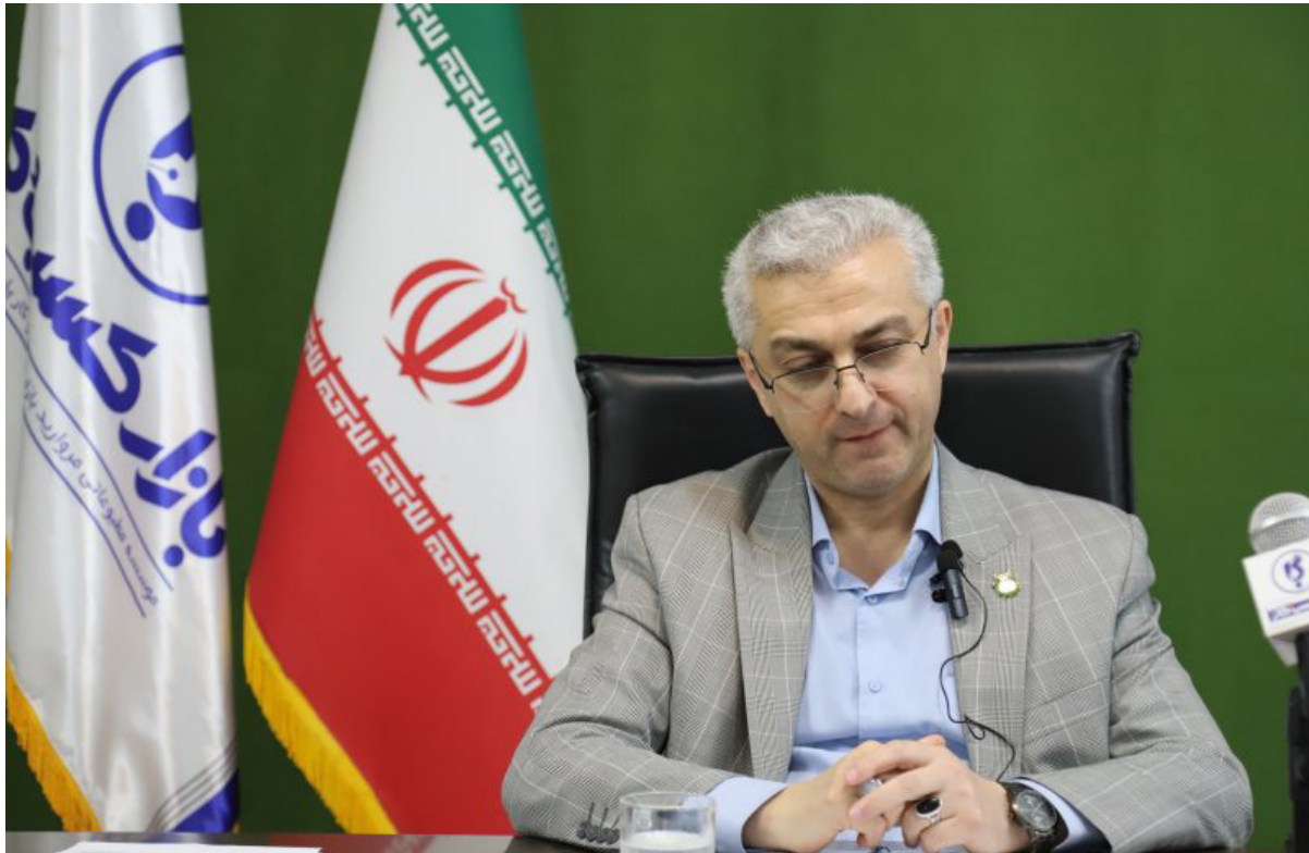
عکس: بازار کسب و کار

او افزود: بخش زیادی از معافیت‌های مالیاتی فقط وقتی قابل استفاده هستند که مودی در سامانه مودیان ثبت‌نام کرده و صورت‌حساب الکترونیکی صادر کند. در غیر این صورت معافیت اعمال نخواهد شد.