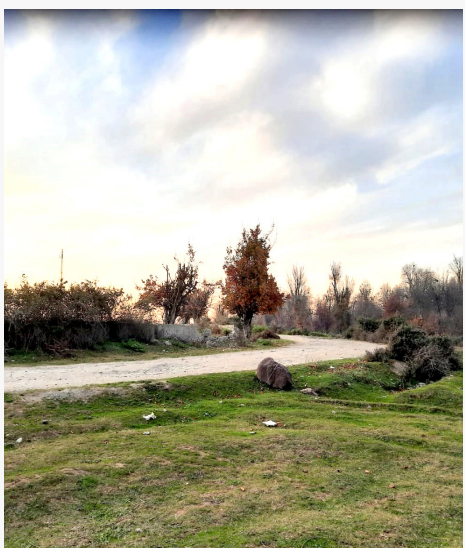
طبیعت جنگل جعفر آباد