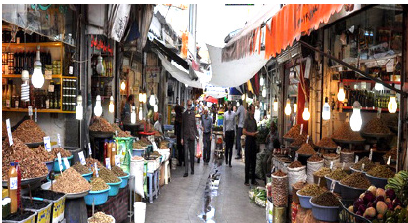
فاطمه فلاح / خبرنگار