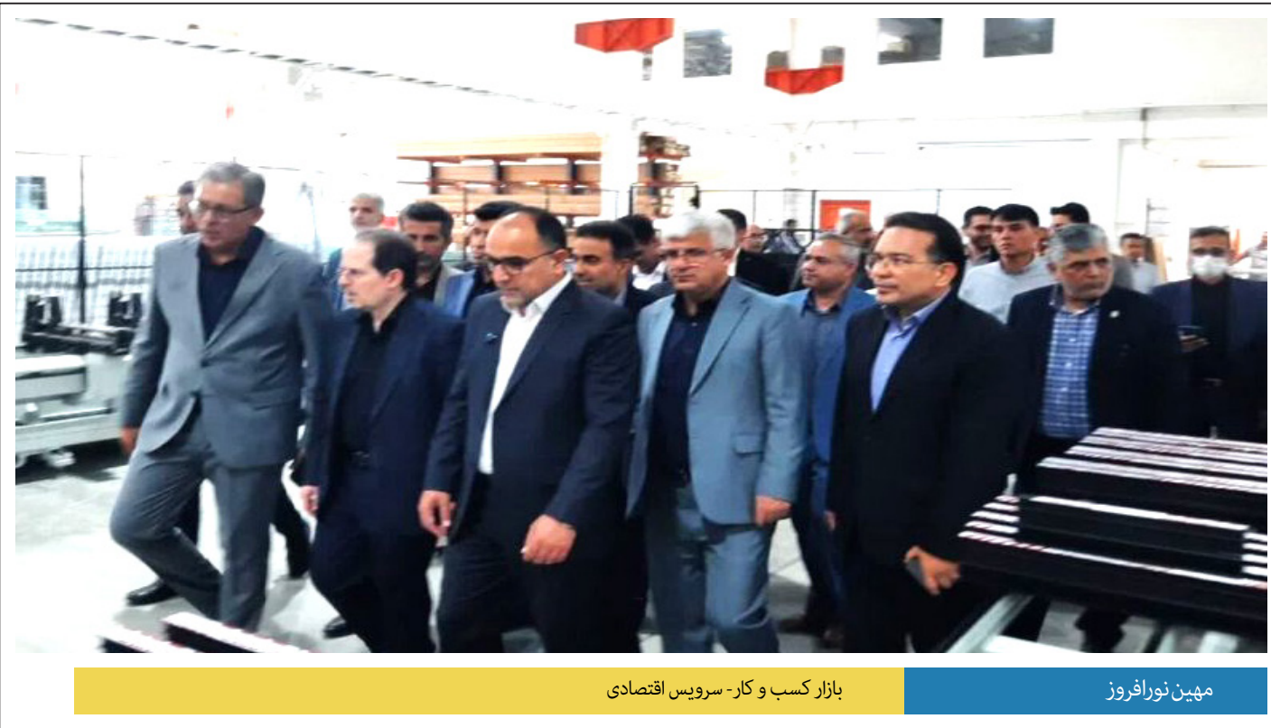
بازار کسب و کار - سرویس اقتصادی

این محدودیت‌ها صرفاً به‌منظور مدیریت بهتر مراسم، تأمین نظم و تسهیل حضور زائران و شرکت‌کنندگان در آیین تشییع و خاکسپاری اعمال می‌شود و تنها تا پایان مراسم ادامه خواهد داشت. / فارس